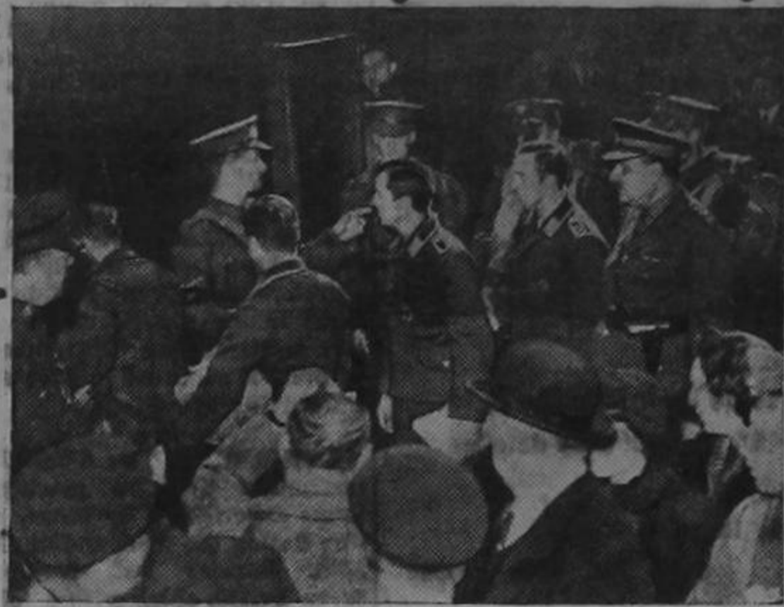
A GROUP OF GERMAN AVIATORS RECENTLY CAPTURED WHEN THEY "BALED OUT" OVER ENGLAND PASSING THROUGH LONDON ON THEIR WAY TO INTERNMENT CAMP.